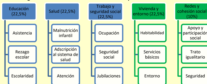
Figura N°1: Dimensiones e indicadores de la pobreza multidimensional*

*En la primera versión había cuatro dimensiones (educación; salud; trabajo y seguridad social; y vivienda) con tres indicadores por dimensión. Luego, la versión final consideró cinco dimensiones y amplió la de “vivienda” e incluyó el concepto de “entorno” y agregó una quinta dimensión de “redes y cohesión social”.