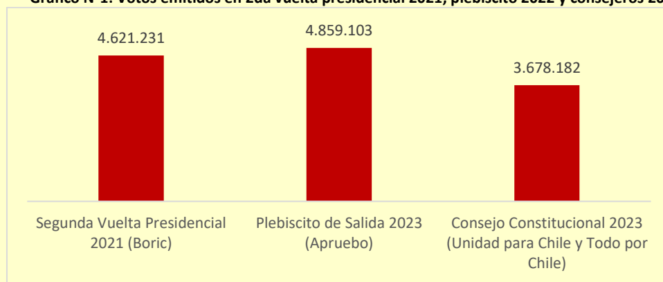
Gráfico N°1: Votos emitidos en 2da vuelta presidencial 2021, plebiscito 2022 y consejeros 2023