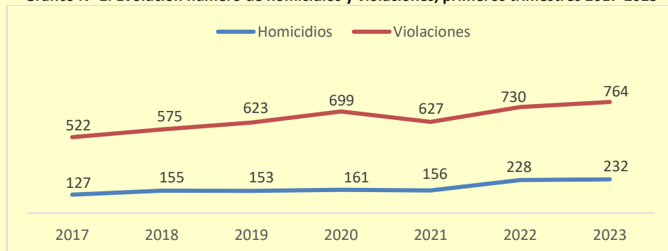
Gráfico N° 1: Evolución número de homicidios y violaciones, primeros trimestres 2017-2023

Fuente: LyD a partir de datos del STOP, Carabineros de Chile.