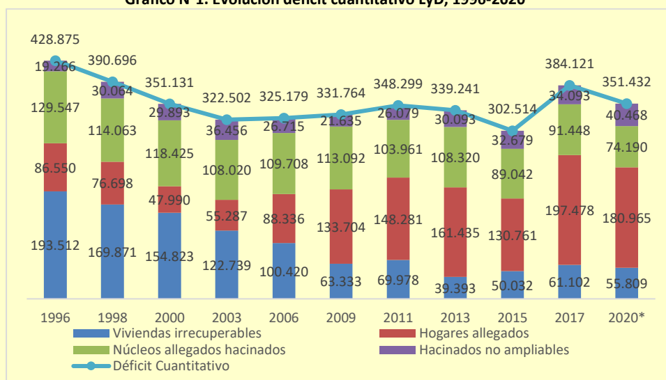
Gráfico N°1. Evolución déficit cuantitativo LyD, 1996-2020* **

Fuente: Elaboración propia a partir de encuestas Casen.