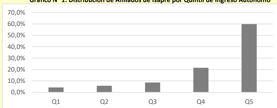
Gráfico N° 1. Distribución de Afiliados de Isapre por Quintil de Ingreso Autónomo