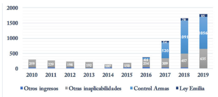
GRÁFICO N°4: DISTRIBUCIÓN DE INGRESOS EN EL TC SEGÚN TIPO (2010-2019)

Fuente | Elaboración propia sobre la base de datos obtenidos de la página web del Tribunal Constitucional.