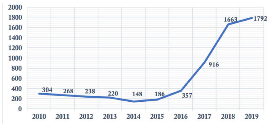
GRÁFICO N°1: EVOLUCIÓN DE LOS INGRESOS TOTALES AL TC (2010-2019)

Fuente | Elaboración propia sobre la base de datos obtenidos de la página web del Tribunal Constitucional.