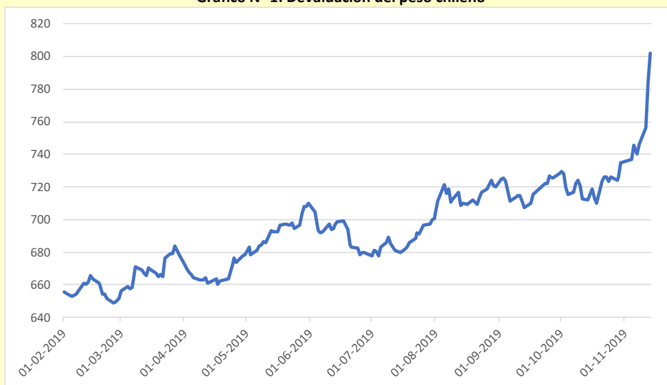
Gráfico N° 1: Devaluación del peso chileno